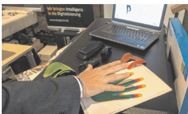
Die Firma Leitz stellte ein System vor, das mittels Handgröße die individuelle Höheneinstellung des Schreibtischnutzers ermittelt.